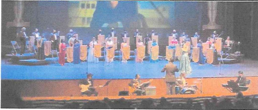
Fotografías conciertos Festival Guatecoral con el Coro Nacional de Guatemala