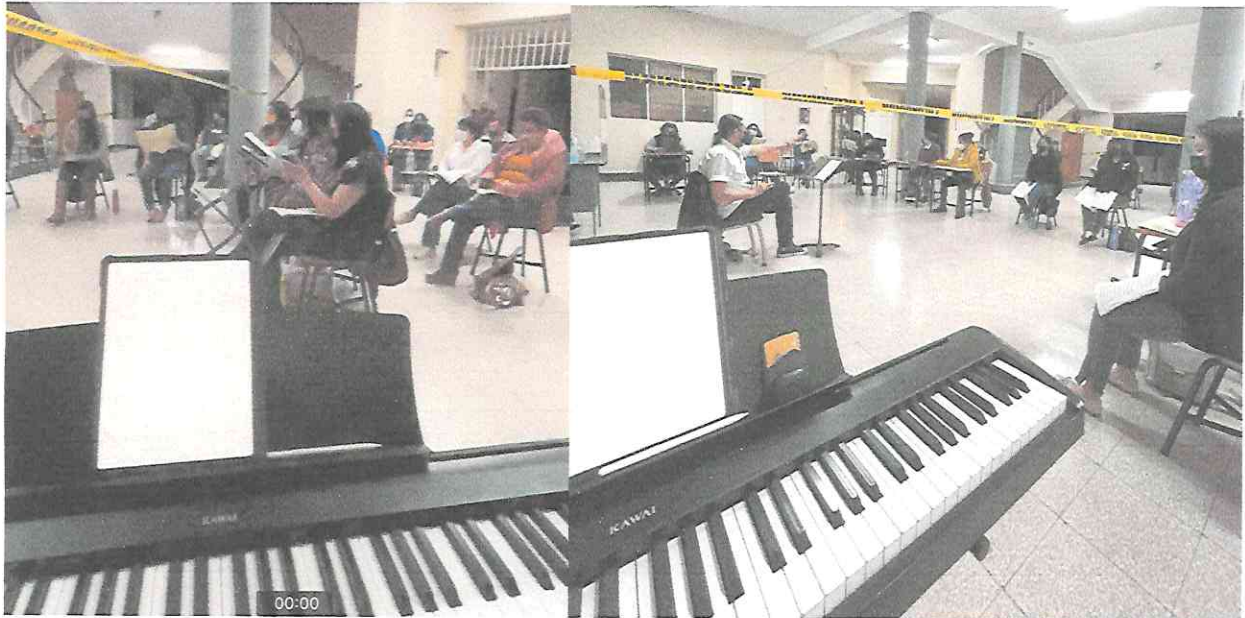
Fotografías ensayos del Coro Nacional de Guatemala en el Conservatorio Nacional de Música