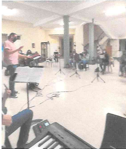
Fotografía ensayo del Coro Nacional de Guatemala en el Conservatorio Nacional de Música