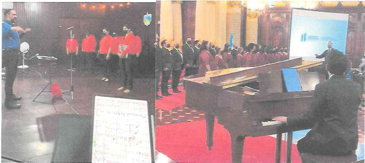
Fotografías conciertos Festival Guatecoral con el Coro Nacional de Guatemala